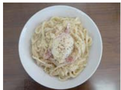
カルボナーラうどん もあるよ。

桂川ウェルネスパーク(里山交流館内) 〒409-0502 山梨県大月市富浜町鳥沢8438 TEL.0554-20-3080