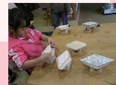
昨年の様子(ひし餅作り) ※内容は毎年異なります

女の子のお祭りだけど、男の子も一緒に楽しもう! 公園で、遊んで作って、ひなまつりのお祝いをしよう♪