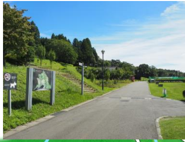
中央ゾーン里山体験棟周辺 クラフト&ワークショップ