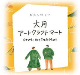
東ゾーン 大月アートクラフトマート