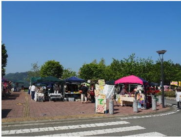
西ゾーンエントランス広場 キッチンカー&飲食 クラフト&ワークショップ

よってって市出展者は「西ゾーンエントランス広場」「中央ゾーン里山体験棟周辺」の2エリアに分散して配置します。※出展エリアは主催者側で割り振らせていただきますので、ご了承ください。来場者が各エリアを満遍なくに行き来するような仕掛けを検討しています。