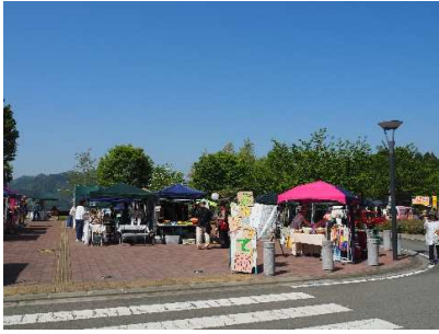
西ゾーンエントランス広場